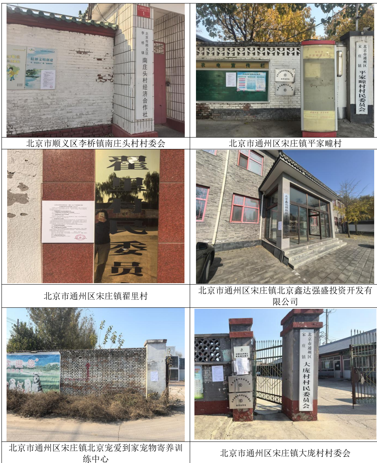
图 3-7 现场张贴公示照片（北京市）