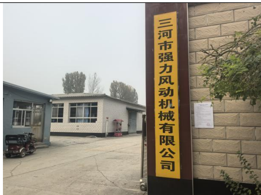
廊坊市三河市新集镇三河市强力风动机械有限 公司