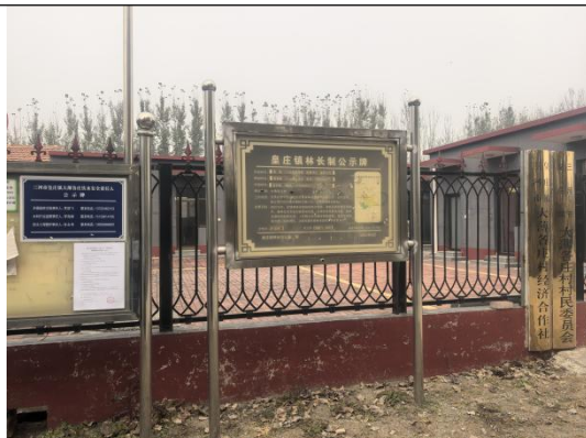
廊坊市三河市皇庄镇大薄各庄村村委会