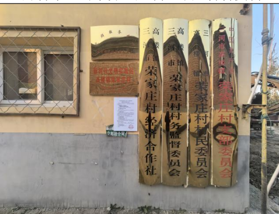
廊坊市三河市高楼镇荣家庄村村委会