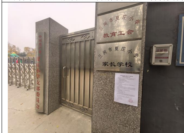
廊坊市三河市杨庄镇夏庄小学