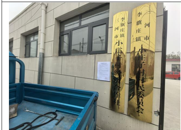
廊坊市三河市李旗庄镇小庄子村村委会