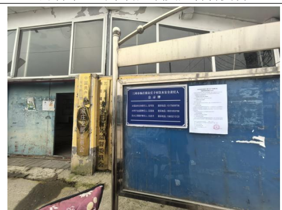
廊坊市三河市杨庄镇安家庄村村委会