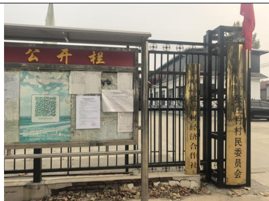
廊坊市三河市新集镇张庄村村委会