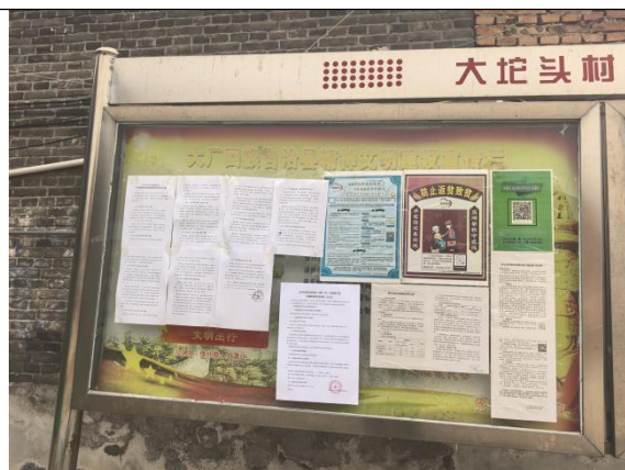
廊坊市大厂回族自治县陈府镇大坨头村