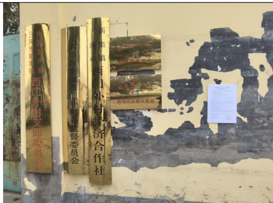
廊坊市三河市新集镇西门外村村委会