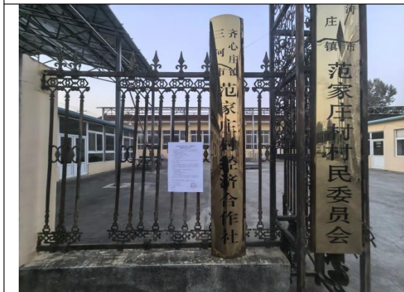
廊坊市三河市齐心庄镇范家庄村村委会