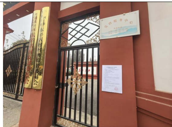
廊坊市三河市李旗庄镇东辛店村村委会