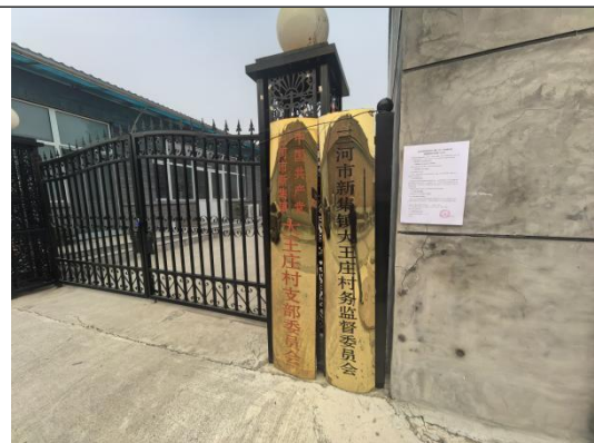
廊坊市三河市新集镇大王庄村村委会