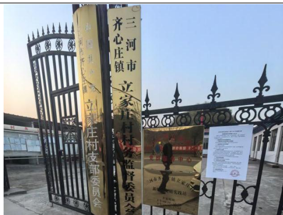
廊坊市三河市齐心庄镇立家庄村村委会