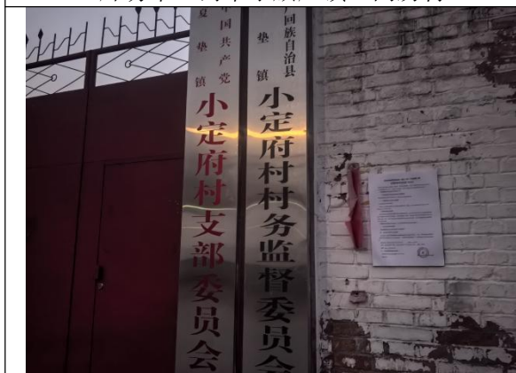
廊坊市大厂回族自治县夏垫镇小定府村村委会