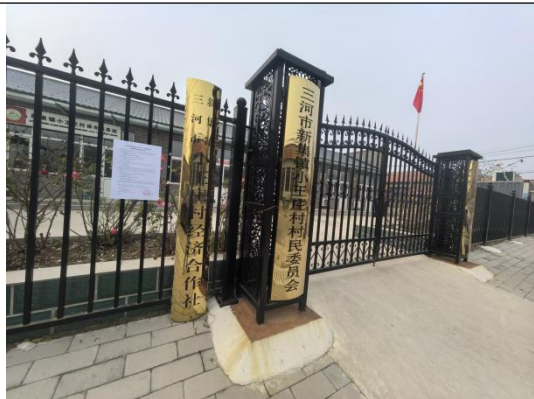
廊坊市三河市新集镇小王庄村村委会