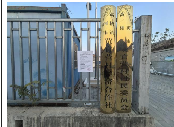
廊坊市三河市高楼镇贾官营村村委会