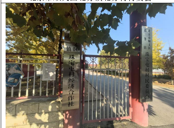
北京市顺义区北务镇珠宝屯村村委会