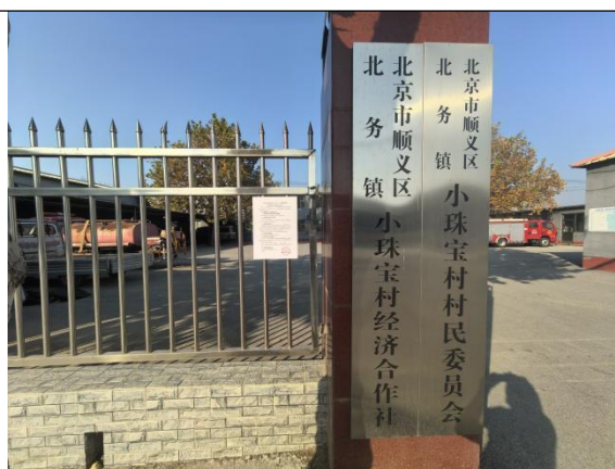
北京市顺义区北务镇小珠宝屯村村委会