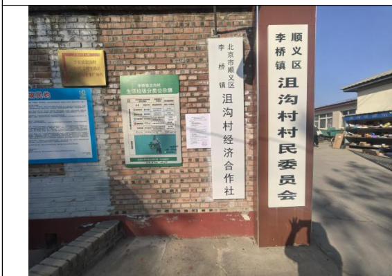
北京市顺义区李桥镇沮沟村村委会