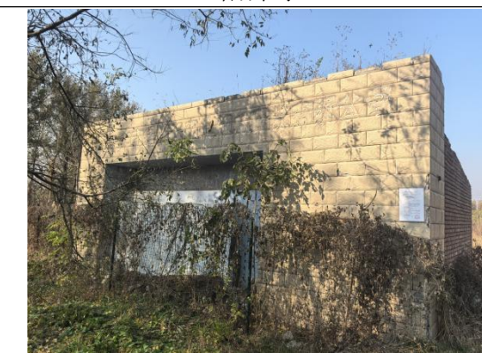
北京绿特农农业技术有限公司