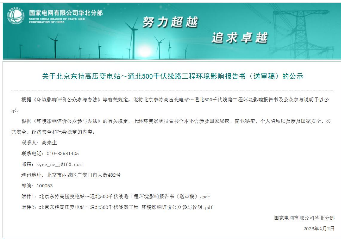
图 6 环境影响报告书送审稿公示（2026 年 4 月 2 日）