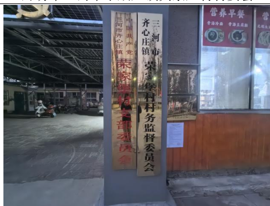
廊坊市三河市齐心庄镇荣家堡村村委会