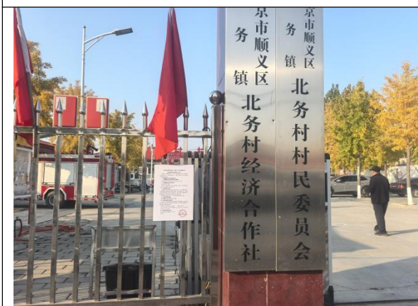
北京市顺义区北务镇北务村村委会