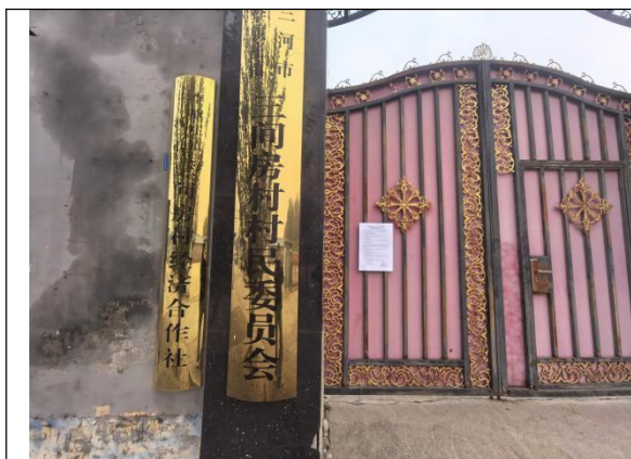
廊坊市三河市李旗庄镇三间房村