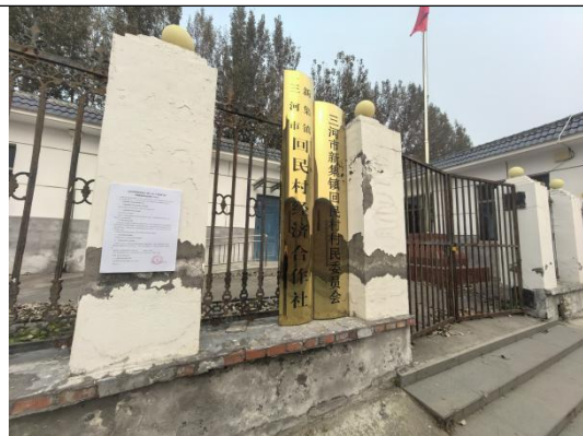
廊坊市三河市新集镇回民村村委会