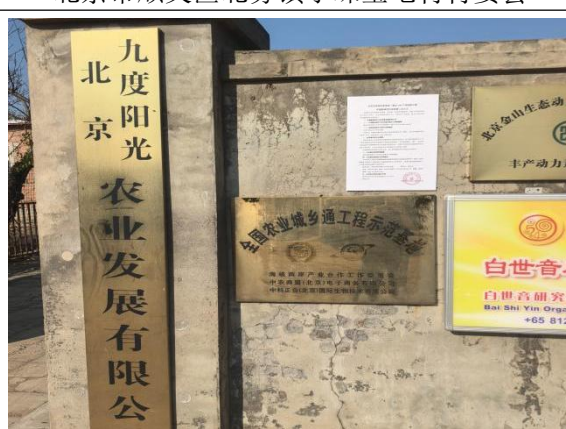
北京市顺义区北务镇北京九度阳光农业发展有限公司