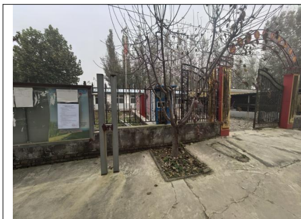
廊坊市三河市皇庄镇小薄各庄村村委会