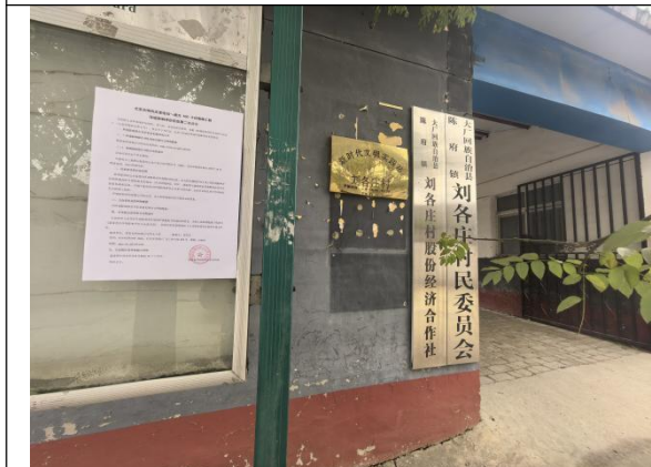
廊坊市大厂回族自治县陈府镇刘各庄村村委会