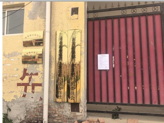
廊坊市三河市新集镇任家庄村村委会