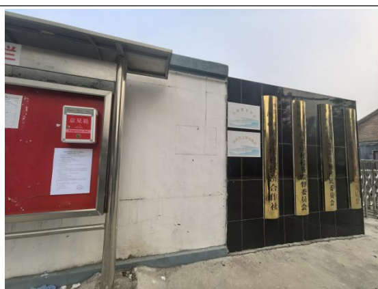
廊坊市三河市李旗庄镇黄亲庄村村委会